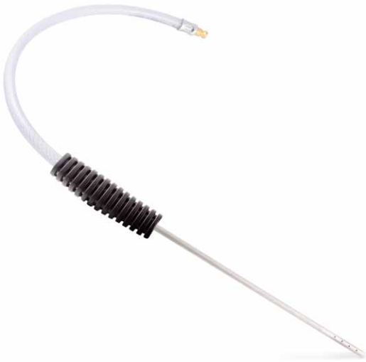
J02256 | JLM Diesel DPF Probe (Langdüse)

Anmerkung zu 4. Falls eine leicht zugängliche Sensorbohrung vorhanden ist, von der sich die Reinigungsflüssigkeit direkt auf den Filter (Monolith) aufsprühen lässt, kann die Langdüse JLM Diesel DPF Probe (J02256) für direkte Reinigung eingesetzt werden. In diesem Fall kann die Bohrung des vorderen Temperatur- oder Drucksensors des Filters verwendet werden, um die Reinigungsflüssigkeit direkt auf den Monolithen aufzusprühen. Die Langdüse beim Einspritzen bewegen, um die gesamte Filterfläche zu behandeln.