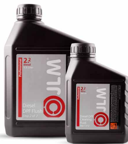
J02230 JLM Diesel DPF Cleaning & Flush-Flüssigkeitsset